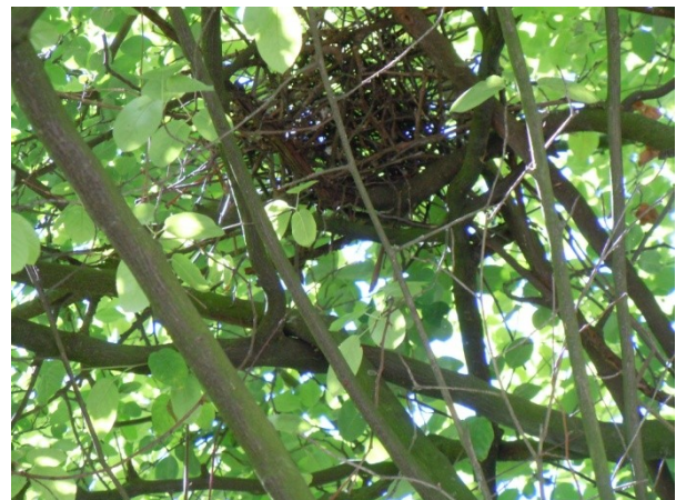
oben: Auch die Tierwelt findet hier Lebensräume

Kinder spielen Fußball auf dem Bolzplatz, am Kiosk gibt es kaltes Bier für die Großen. Hier erleben wir, was in unserer schnellen Zeit immer seltener wird: Gemeinschaft zwischen Freunden und Fremden. Und das alles in der Öffentlichkeit, direkt vor unserer Haustür. Hier ist das Klima gut, hier