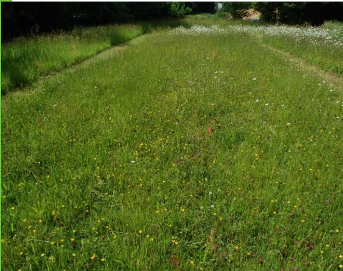
821 Südostrand mehr Kriechender Hahnenfuß*, kaum Margeriten

Saatgutmischung: Frischwiese 70/30; Vorbehandlung der Fl.: kein Oberbodenabtrag, Sandauftrag