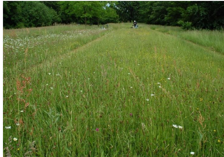
827 Nordwestrand weniger Kriechender Hahnenfuß*, ein paar Margeriten